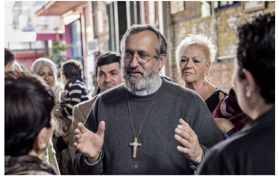
Un'immagine tratta da uno spot televisivo dell'8xmille