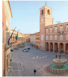
Una piazza di Fabriano