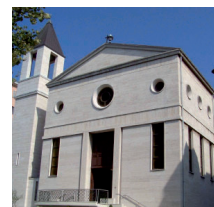
La parrocchia triestina

ambientale provocato nel tempo dalla costruzione della megacentrale a turbogas e soprattutto della più grande discarica intera d'Europa», spiegano i promotori. Da qui la candidatura per corsi di formazione che attivino politiche agricole e ambientali (potatore, innestatore), in grado di offrire figure professionali oggi pressoché scomparse, di cui invece le aziende agricole avrebbero forte bisogno. Una formazione in parte anche multimediale, con stage nel nuovo oratorio, realizzato anche con fondi 8xmille. Ossigeno per chi è in cerca di un'assunzione, professionalizzante anche sotto il profilo della tutela ambientale. E decisivo nel creare un'alternativa tra i giovani esposti al diktat economico della criminalità organizzata. I corsi puntano a dare vita a una rete di enti pubblici (il Comune, la Camera di commercio di Caserta, gli istituti di agrotecnica) e aziende private. Tra gli obiettivi anche il miglioramento dell'inclusione degli immigrati, che oggi rappresentano circa l'11% della popolazione. Una sfida nel segno della dottrina sociale della Chiesa, da evidenziare anche attraverso i gruppi cattolici della provincia, con un lavoro di raccordo affidato ad un altro giovane parroco, padre Raffaele Farina. Il primo anno i corsi gratuiti metteranno a disposizione 24 posti, e nel tempo sarà possibile aggiungere altri. Anche in vista dell'auspicata estensione del piano formativo ai profili di trattorista, carrellista, montatore e manutentore di serre. (L.Del.)